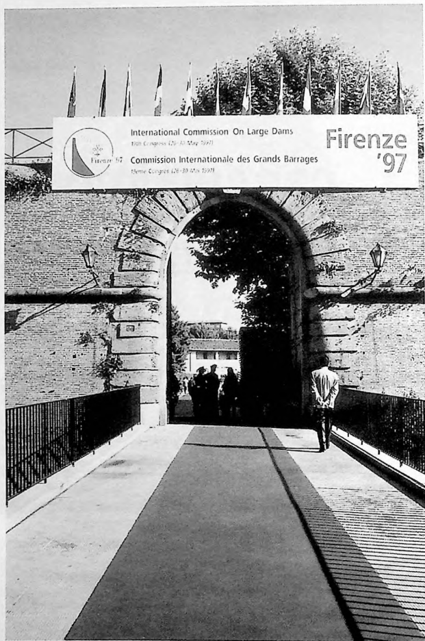
Fortezza da Basso - Main Entrance of the Congress

Fortezza da Basso - Entrée principale du Congrès