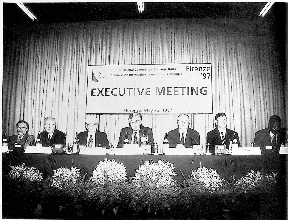
ICOLD Officers/Bureau de la CIGB