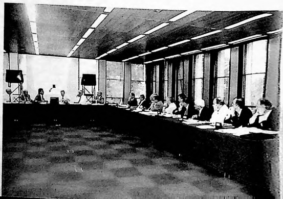
Meeting of Chairmen of ICOLD Committees