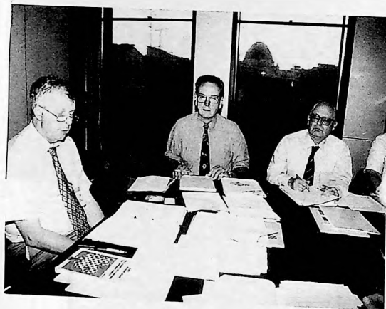
Meeting of the Committee on Rehabilitation