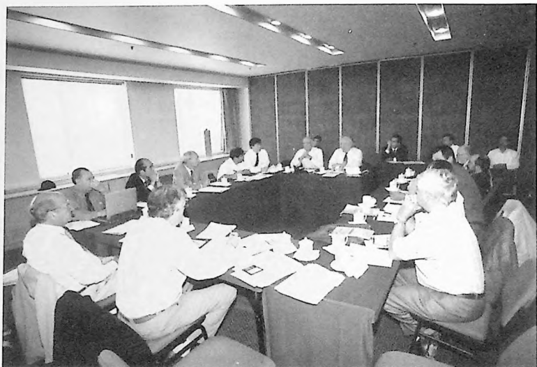
Attendance during Committee Meetings Participation aux Reunions de Comites