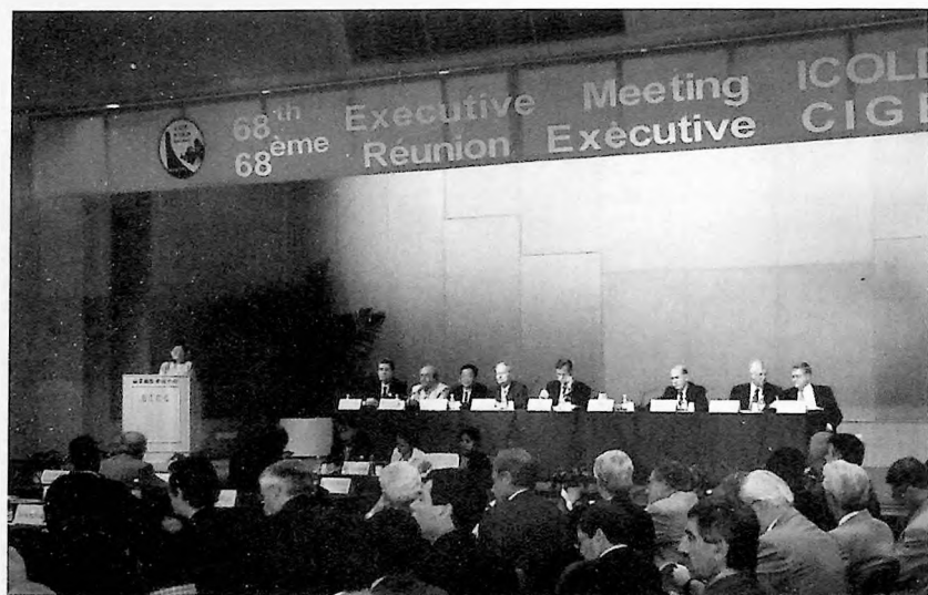
Opening of the Executive Meeting Ouverture de la Réunion Exécutive