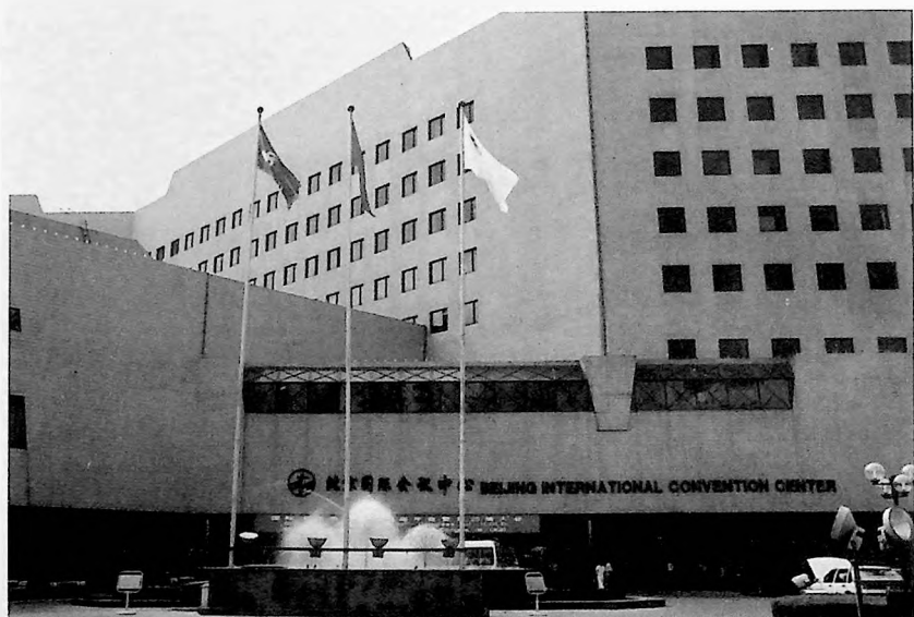
Beijing International Convention Center – Main Entrance of the Congress Centre de Conférences Internationales de Beijing – Entrée principale du Congrès