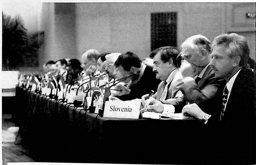
Some voting members Quelques délégués officiels