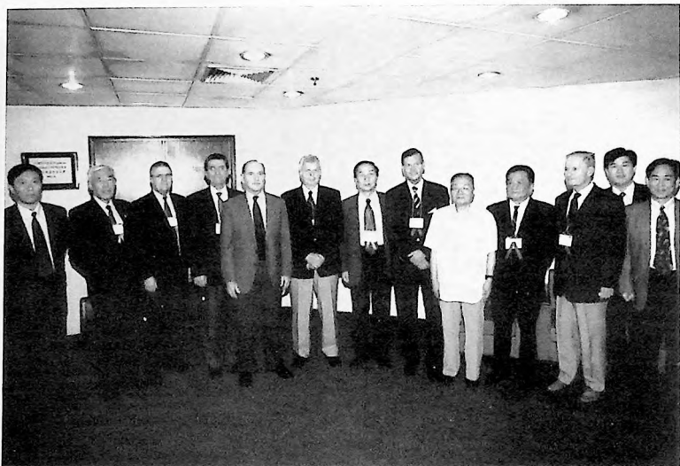
Some of ICOLD Officers and of the Chinese Committee Quelques Membres du Bureau et du Comité Chinois