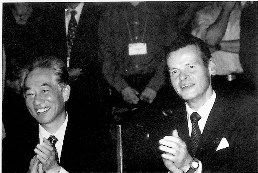
Wang Shucheng, Minister of Water Resources and Chairman, Organising Committee Kaare Hoeg, President, ICOLD Wang Shucheng, Ministre des Ressources en Eau et Président du Comité d'Organisation Kaare Hoeg, Président de la CIGB